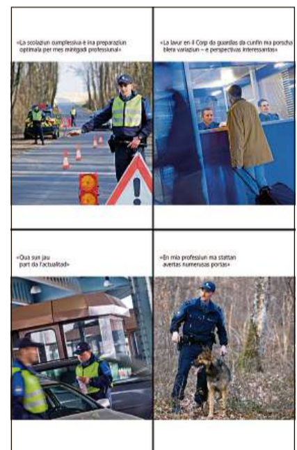
Broschura «Guardia da cunfin – ina professiun cun avegnir».

ter las prescripziuns d'entrada ed il servetsch da duana, la surveglianza dals cunfins, il tir e la psicologia da lavur. Ozendi pretenda il cumbat cunter la criminalitad però er enconuschentschas spezializadas. Perquai collavuran ils pli differents spezialists en il Corp da guardias da cunfin. Ils manaders da chauns per exempel furman, ensemen cun lur chauns spezialisads sin meds narcotics e materials explosivs, in element impurtant da la controlla quotidiana. Ultra da quai èn ils suandants secturs spezialisads, occupads da guardias da cunfin cun in'instrucziun specifica, in sustegn indispensabel en la lavur da mintgadi: falsificaziun da documents, meds narcotics, revisiun da vehichels e procuraziun d'infurmaziuns.