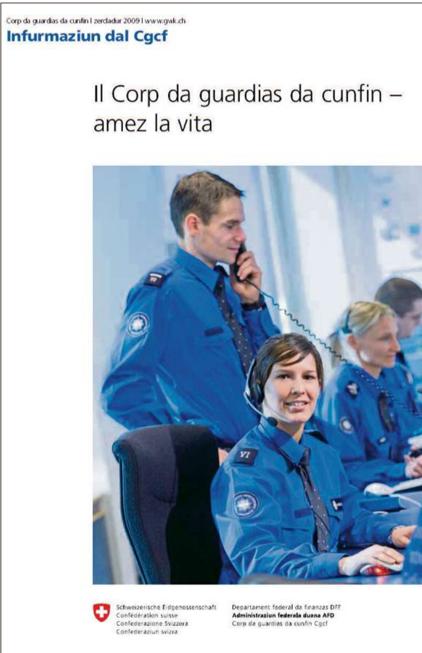
Il Corp da guardias da cunfin – amez la vita. Infurmaziun dal Cgcf. Corp da guardias da cunfin | zercladur 2009 | www.cgcf.ch

Incumbensas da la polizia d'esters: En quest sector han las guardias da cunfin da cumbatter las entradas e sortidas illegalas sco era la dimora illegala, la lavur